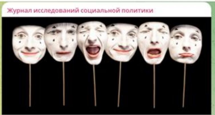
Чувства, эмоции и границы: терапевтический поворот в современной России 👁 102 21:41 ❤

Журнал исследований социальной политики "Сегодня любое личное и коллективное событие оценивается степенью его эмоциональности", – пишет Юлия Лернер (2022). Язык психотерапии теперь используется для описания отношений и с близкими, и с самим собой, и с государством. Появляются и получают широкое распространение новые практики заботы, формы знания о себе, режимы эмоциональности, а вокруг этих новшеств возникают конфликты и поломки в коммуникации. Процесс психологизации культуры и общества, терапевтический поворот, концептуализируется разными исследователями уже довольно давно. О появлении "психологического человека" и заботе о себе как новой религии писал Филипп Рифф (1966). Николас Роуз (1990) говорит о том, как государственная, институциональная, экономическая, экспертная и другие виды власти формируют новую, терапевтическую личность (Self). Ева Иллуз (2006, 2007, 2018)